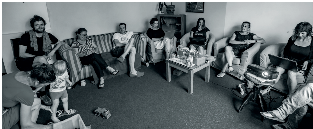
Konzultační místnost CDZ při raní poradě týmu

Centra duševního zdraví jsou novým prvkem v systému psychiatrické péče v České republice a zavádí se v souvislosti s Reformou psychiatrické péče v ČR. Nenahrazují současné části systému – psychiatrické ambulance nebo akutní péči v psychiatrických nemocnicích.