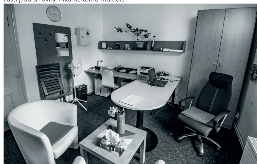
V centru duševního zdraví nesmí chybět ordinace

Karoliny Světlé 13 323 00 Plzeň Tel.: 377 429 616, 737 163 204 cdz@ledovec.cz www.cdz-plzen.cz