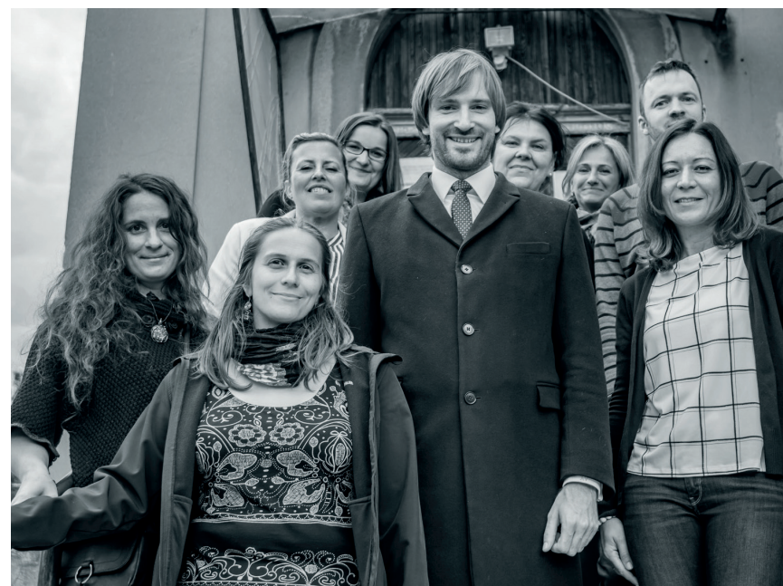
Část týmu Centra duševního zdraví s panem ministrem (a vrbou - vetřelcem), foto: Jan Zeman

● Jak hodnotíš zrození CDZ? Jaký byl jeho příchod na svět?